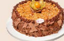
Bolo de mousse com trufa