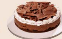
Torta mousse de chocolate