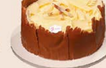
Brigadeiro com chocolate