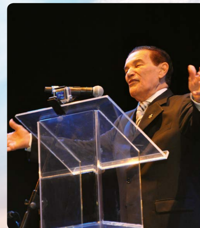
Divaldo Pereira Franco

Vamos pazear, nos dar a mão e fazer a paz. A paz não tem caminho, dizia Gandhi, ela é o caminho, por onde nós desembulhemos, de dentro para fora em cujo seio encontramos a plenitude, a felicidade.”