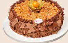
Bolo de mousse com trufa