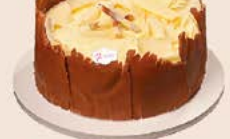
Brigadeiro com chocolate