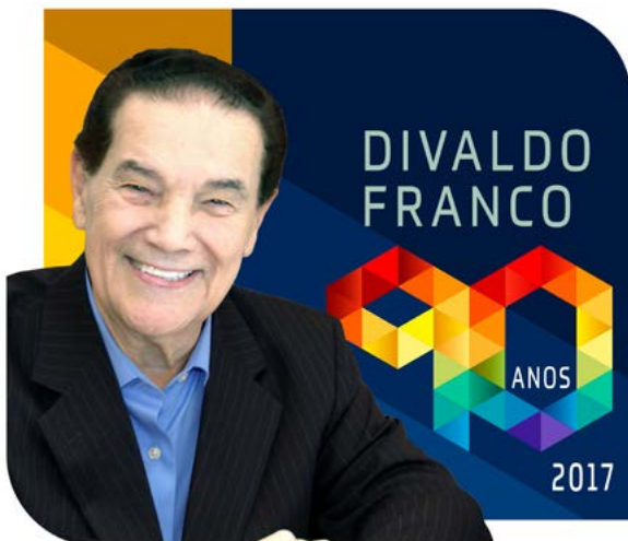
70 ANOS DE CONFERÊNCIAS E PALESTRAS 70 YEARS OF CONFERENCES AND LECTURES

Não postergues a luminosa experiência, iniciando-a quanto antes. ▲