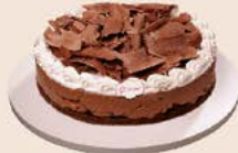
Torta mousse de chocolate