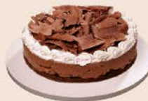
Torta mousse de chocolate