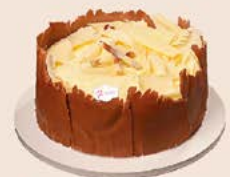
Brigadeiro com chocolate