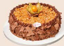
Bolo de mousse com trufa