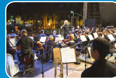
Amparo - SP

A primeira edição do Você e a Paz em São Paulo será realizada no dia 26 de setembro, em local a ser definido. Faça parte deste movimento e dê a sua colaboração em prol de uma sociedade mais fraterna, humana, justa e menos violenta!