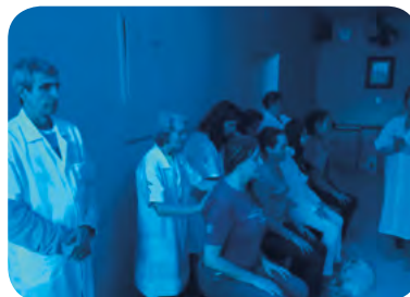
Tratamento - Sala Azul