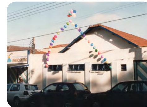
Fachada do Reencontro - 1996

E assim, ainda com a reforma em andamento, a Associação de Desenvolvimento Espiritual Reencontro abriu as portas em 7 de maio de 1995, com aproximadamente 30 voluntários, para dar acolhimento àqueles que vinham em busca de ajuda. O nome foi escolhido pelo grupo que, após pensarem em várias opções, levaram suas escolhas pessoais em uma reunião em que foi votado o melhor nome.