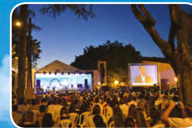
Foz do Iguaçu - RS