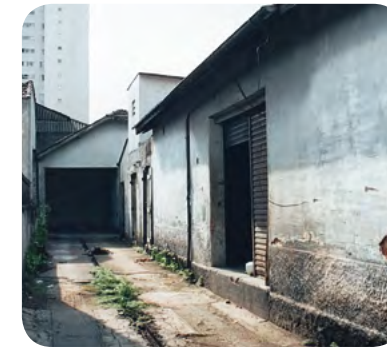
Imóvel antes da reforma

O início A preparação para a fundação da casa começou no final de 1994. Foi um trabalho difícil, mas muito orquestrado, unido, forte e com muito apoio da espiritualidade. Encontrar um local foi o primeiro passo. “Passando por aqui eu vi este lugar que estava para vender e fechado havia um bom tempo. Tudo estava bastante deteriorado. Logo fomos atrás de alguém que pudesse colaborar comprando o imóvel e alguns dos integrantes do grupo assumiram isso, dividindo em cotas de participação, e até hoje o local é emprestado em comodato. De cara, foi preciso muita reforma, pois tudo estava caindo aos pedaços”, conta Jonas. Cada associado comprou uma lanterna (que na época era utilizada no passe) e uma cadeira para o assistido, além de vassouras, rodos, produtos de limpeza, materiais, móveis, descartáveis, e passaram a contribuir com uma mensalidade para a manutenção da casa, prática até hoje adotada.