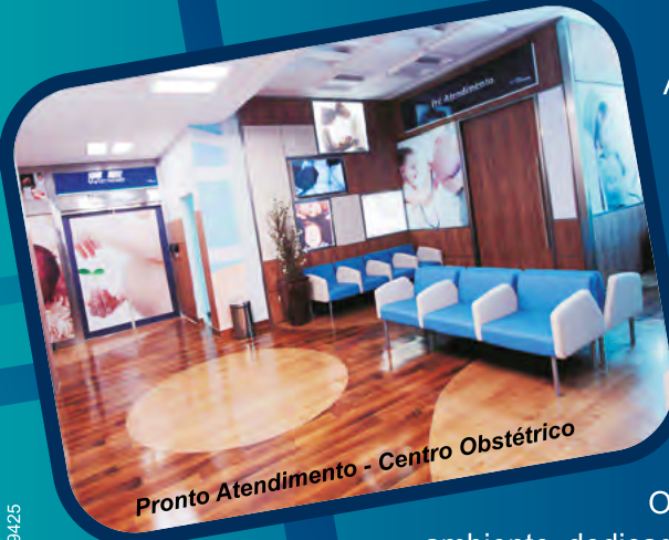
Pronto Atendimento - Centro Obstétrico

A Ala Pediátrica, situada no 5º andar do Hospital e Maternidade São Cristóvão, é voltada à internação, com apartamentos, enfermaria e UTI Infantil. O local possui área de recreação, WiFi, câmeras de segurança, detector de fumaça, janelas modernas de vidro termo acústico, chamada de Enfermagem, TVs, iluminação em led, frigobar, cofre eletrônico e decoração temática.