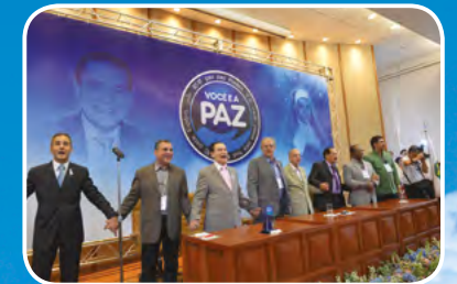
Brasília - DF