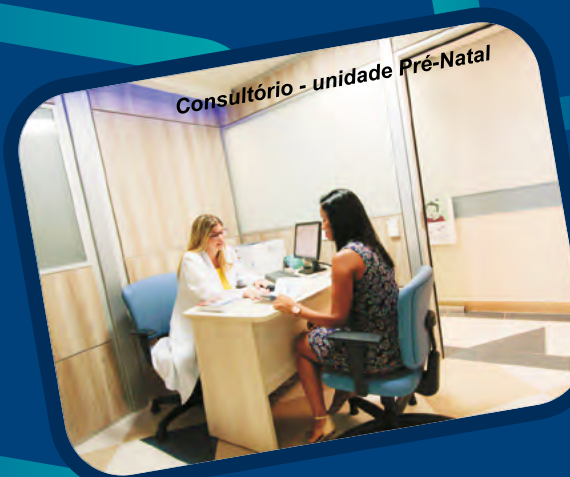
Consultório - unidade Pré-Natal

O Pronto Atendimento Obstétrico conta com um ambiente dedicado à recepção e cuidados com a saúde das gestantes. O local passou por uma reforma e ampliou a área de espera e de observação/ medicação. O setor apresenta, também, um pré-atendimento para agilizar e direcionar melhor o processo. Além disso, foi criado um espaço aconchegante, com iluminação em led, mobiliários modernos e práticos, proporcionando mais conforto às pacientes.