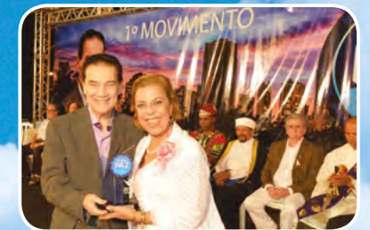
Londrina - PR