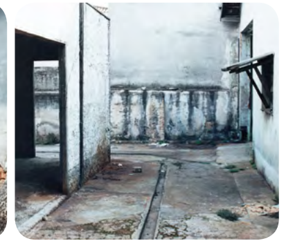
Imóvel antes da reforma

E assim, ainda com a reforma em andamento, a Associação de Desenvolvimento Espiritual Reencontro abriu as portas em 7 de maio de 1995, com aproximadamente 30 voluntários, para dar acolhimento àqueles que vinham em busca de ajuda. O nome foi escolhido pelo grupo que, após pensarem em várias opções, levaram suas escolhas pessoais em uma reunião em que foi votado o melhor nome.