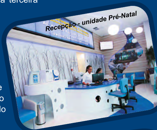
Recepção - unidade Pré-Natal

Atendimento às beneficiárias do Plano de Saúde e particular.