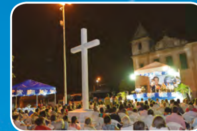
Salvador - BA