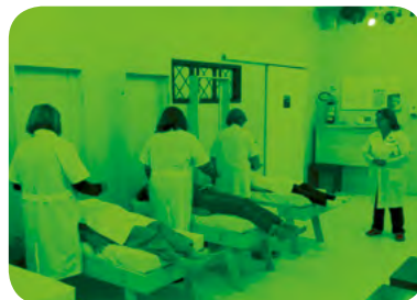
Tratamento - Sala Verde

O Reencontro hoje Aproximadamente 450 pessoas integram o corpo de voluntários do Reencontro atualmente, divididos em vários trabalhos. A casa funciona diariamente, de segunda a sábado, e uma vez por mês aos domingos pela manhã no tratamento de Terapia de Cura Integral.