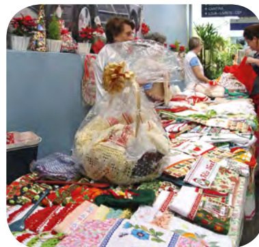
Grupo Amor e Boa Vontade

E um grupo de voluntárias, com o objetivo de auxiliar nas obras sociais da casa, criou o Grupo Amor e Boa Vontade, que realiza trabalhos manuais de utensílios domésticos, enfeites, roupas e afins, que são vendidos em ocasiões especiais como Dia das Mães e Natal.