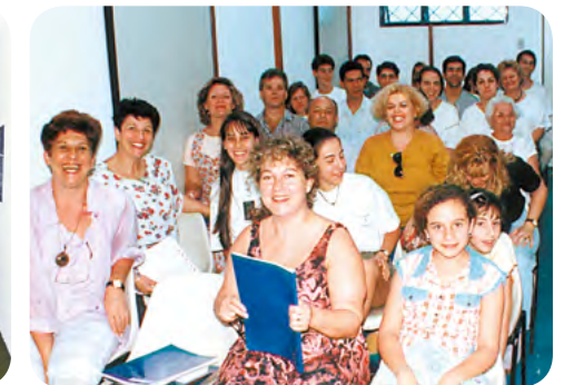
Primeiro curso - 1995

O começo dos trabalhos foi difícil, mas havia muita união, apoio, cooperação e amor. Foi preparado um local para o acolhimento dos assistidos e uma sala para a aplicação dos passes. No começo a casa funcionava somente às terças-feiras. Algum tempo depois, foi iniciado o trabalho na Sala Azul (direcionado ao equilíbrio emocional) e na Sala Verde (dirigido aos assistidos que estejam passando por problemas de saúde). A cada sessão de atendimento o número de assistidos aumentava exponencialmente e depois de seis meses de funcionamento a casa passou a atender por dois dias na semana, às terças e quintas-feiras.