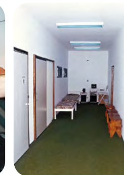
Sala Azul - 1996