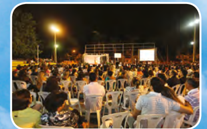
Bom Jesus dos Perdões - BA