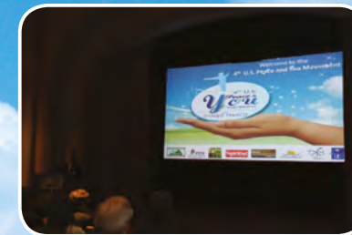
Washington - EUA