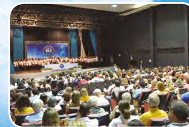
Taguatinga - DF